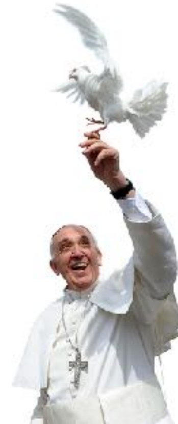
Papa Francisco (Roma, 8.09.2016)

“Podes falar de paz com belas palavras, fazer uma grande conferência, mas se nas tuas pequenas coisas, no teu coração, não há paz, se na tua família não há paz, se no teu bairro não há paz, no teu local de trabalho não há paz, então não haverá paz no mundo!”